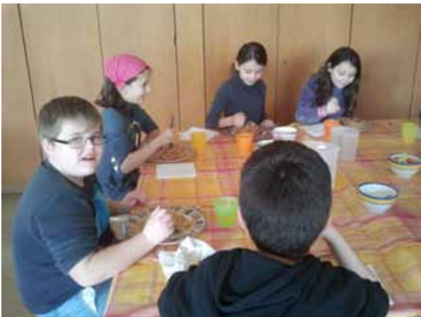
Klasse 3b Abschlussessen 1.Semester