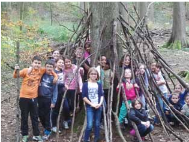
Gemeinsamer Waldnachmittag der Klasse 3b